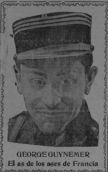
GEORGE GUYNERMER El as de los ases de Francia

Año X San José de Costa Rica, DOMINGO 22 de JULIO de 1917 No. 2970