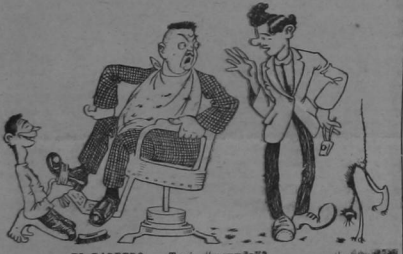
EL BARBERO. — Trae "menudo"? EL CLIENTE. — No. EL BARBERO. — Entón ces que lo acabe de pelar su abuelo!